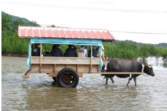
西表島から由布島へは「水牛車」に乗って渡ります。観光バスが到着すると待機していた水牛車が一齐に動きます。

速度でのんびり進みました。竹富島では島の西側にある「星砂海岸」まで、レンタサイクルで行って来ました。最後は17時発のクルーズ船に乗って、15分で石垣島へ戻りツアー終了。「西表島・由布島・竹富島3島めぐり」は本当にすばらしく、大満足の1日でした。2日目の夕食は大人気のステーキハウスで「石垣牛」をいただきました。160グラムの「特上ステーキコース」を食べま