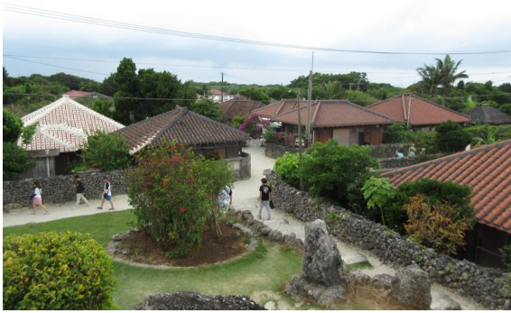
竹富島の集落にある「なごみの塔」からの風景。この風景が癒されます。島内の移動にはレンタサイクルが便利でした。