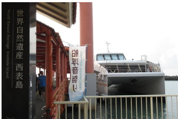
石垣島からクルーズ船で45分、最初の「西表島」に到着。ここは島全体が「世界自然遺産」に指定されています。

2日目は今回の旅行のメインイベント「西表島・由布島・竹富島3島めぐり」に出発。石垣港までクルマで行き、「具志堅用高像」がある埠頭棧橋か