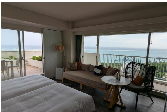
オーシャンウイングの高層階コーナールームというカテゴリーのお部屋。コーナールームは明るくて気持ちいいです。

ANAはプレミアムクラスを令和8年5月に「ファーストクラス」に名称変更しています。 石垣空港到着後、予約しておいたレンタカーを運転して川平湾へ。予約時間より早く到着したため、30分早い船に乗せてもらえました。グラスボートは船底がガラス張りになっていて、海の中を見ることができます。きれいなサンゴ礁の海にきれいなさかなたち。そしてウミガメも見ることが