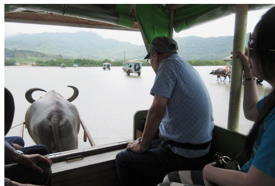
牛さんたちは慣れたもので、途中で何度も止まって動かなくなります。時にはおしっこもジャージャーしていました。