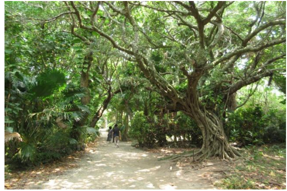
由布島の原生林。散策ルートがあり歩いて回れるのですが、ここが日本であることを忘れてしまいそうです。