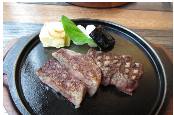
石垣で有名なステーキハウス「PAPOIYA」へ石垣牛のステーキを食べに来ました。これがめちゃくちゃうまかったです。