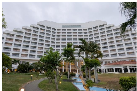
今回滞在したのは「ANAインターコンチネンタル石垣リゾート」。最高ランクの五つ星ホテルで石垣島でNO.1との評判。