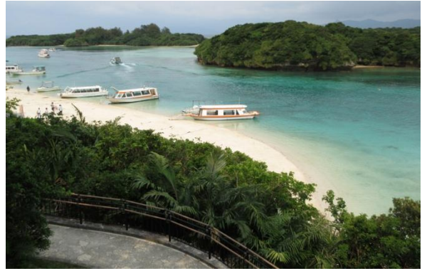
石垣島の北西部にある川平湾。グラスボートでサンゴ礁の海の中を覗くことができるアクティビティが人気です。