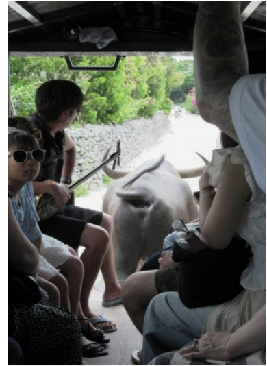
竹富島でも水牛車に乗りました。ガイドさんが三線で島唄などを演奏。

最終日は飛行機の時間まで石垣市内でショッピング。「石垣の塩」や特産のさとうきびの「黒糖」のお菓子、それに「生のパイナップル」や「地ビールセット」も買って