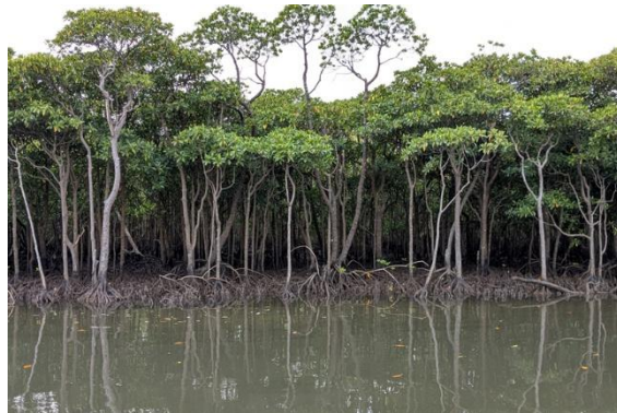
「仲間川マングローブクルーズ」。マングローブというのは湿地に生える樹木たちの総称なのだそうですね。

ら8時15分発のクルーズ船で出航。約45分で西表島へ到着後、船を乗り換え「仲間川マングローブクルーズ」に出発。この日はちょうど