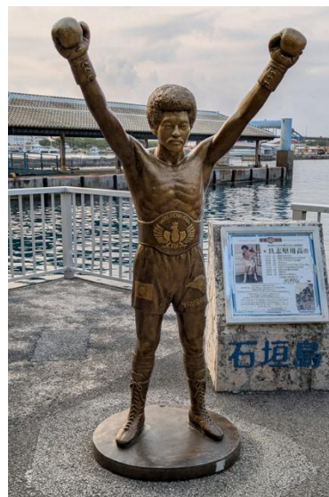
石垣島のヒーロー「具志堅用高」の銅像。人気記念撮影スポットです。

2日目は今回の旅行のメインイベント「西表島・由布島・竹富島3島めぐり」に出発。石垣港までクルマで行き、「具志堅用高像」がある埠頭棧橋か