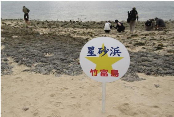
竹富島の西海岸にある「星砂海岸」。みんな一生けんめい星のカタチの小さな砂の粒を探していました。

最終日は飛行機の時間まで石垣市内でショッピング。「石垣の塩」や特産のさとうきびの「黒糖」のお菓子、それに「生のパイナップル」や「地ビールセット」も買って