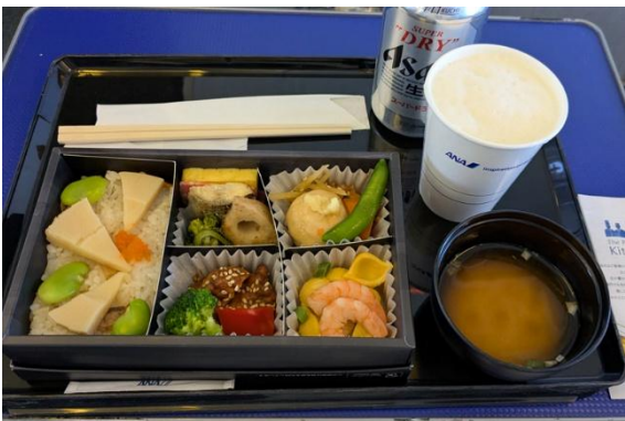
帰りの石垣～セントレア便の食事。今回は昼食メニューでまさに「空弁」です。飲み物にはビールをいただきました。

帰りました。目星を付けていたショップをすべて回ったところで空港へ戻りレンタカー返却。ターミナルビルのイーティンで名物「八重山そば」を食べて、今回の八重山諸島旅行の全予定をコンプリート。復路便もプレミアムクラスでゆったり。食事はとてもおいしく、今度はビールを飲みました。石垣からセントレアまでの飛行時間は2時間ちょっとなのですが、あつという間に着いてしまいました。ツアーだったらこんな快適なフライトは味わえないので、個人手配して大正解の旅でした。