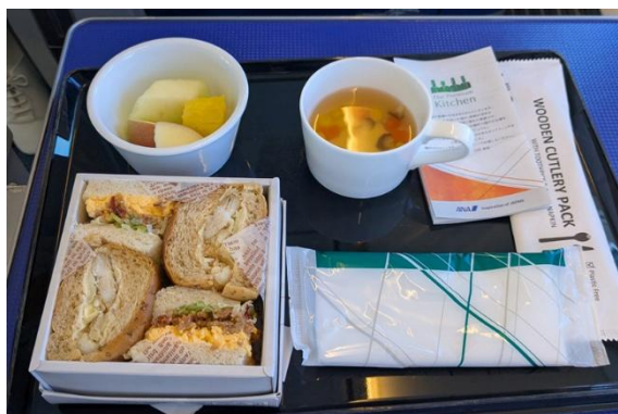
10時59分までに出発する便で提供されるプレミアムクラスの食事。サンドイッチの詰め合わせでおいしかったです。

石垣島まではセントレアからANAの直行便があり、この時はまだ出発まで3か月前でしたが、すでに普通席の最安早割航空券は売り切れていて、次のランクになると意外に安くなかったのです。そこで何気にプレミアムクラスの運賃を見たところ、普通席との金額差は思ったほどではなかった。で、ちょっとリッチに往復とも「プレミアムクラス」を利用することにしました。ホテルは予約サイトでANAインターコンチの「コーナールームオーシャンウイングハイフロア」を、石垣島の足にはレンタカーをそれぞれ早割で予約。かなり豪華な内容になりましたが、それでもツアーより安く手配できました。出発当日、セントレア到着後、プレミアムクラス専用カウンターで手荷物タグを発行。出発までは国内線制限エリア