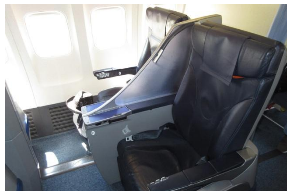
セントレア発着便に使われているB737-800のプレミアムクラス座席。ゆったりしていますがそろそろ古さを感じました。