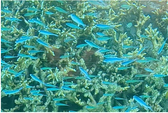
船長さんがさかなの群れやサンゴ礁があるスポットをよく知っていて、マイクでガイドしながら操縦してくれます。