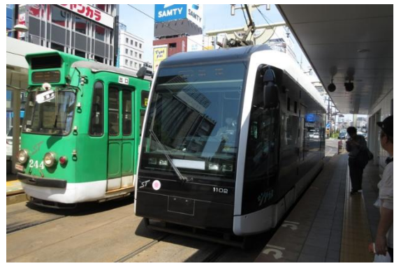
用がなくても必ず市電には乗車します。札幌市電はいいことに環状路線。すすきので乗車してほぼ1周乗車しました。

この日はホテルのビュフェ朝食をがつつり食べたせいで、なかなかお腹が空かなくなったのですが、12時を過ぎてそろそろお昼ごはんを食べに行くことにしました。札幌でのお昼ごはんは「札幌ラーメン」と決めていて、すすきの有名な「ニッカウイスキー看板」のあるすすきのビルの南、元祖ラーメン横丁にある「札幌ラーメン・悠(はるか)」へ。