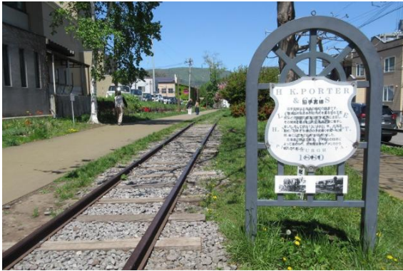
北海道初の鉄道路線「旧手宮線」。以前は札幌以上の大都会だった小樽の繁栄をしのぶ遺構のひとつです。