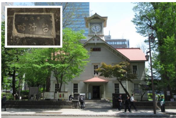
日本3大がっかり観光地と呼ばれている「札幌時計台」ですが、それでも多くの観光客が記念撮影していました。