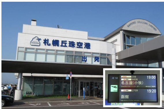
札幌丘珠空港は小さな空港ですが、札幌市内中心部からは地下鉄と路線バスで20～30分の好立地。