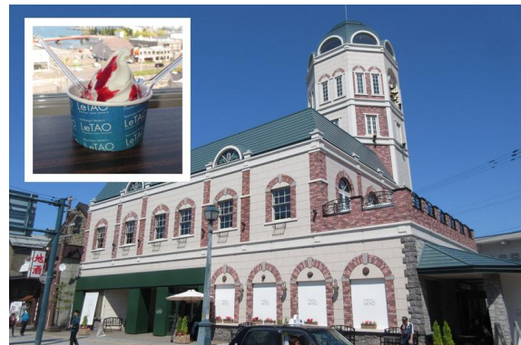
ルタオ本店。最上階展望室は無料なので1階で本店限定のソフトクリーム「マリアーージュ」を購入。展望室で食べました。