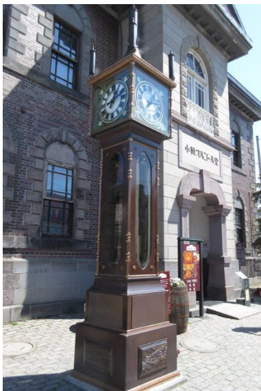
「小樽オルゴール堂」の蒸気時計。15分おきに蒸気で「ウエストミンスターの鐘」を奏で続けていました。

野リゾートがホテルにリノベーション。建物内部は階段などがそのまま使われ、当時の面影をしのぶことができました。