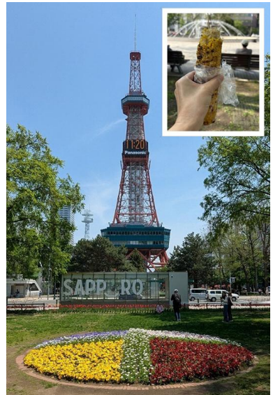
「札幌大通公園」。名古屋の久屋大通公園と似ていますが、テレビ塔が赤いので公園が東西に配置されています。