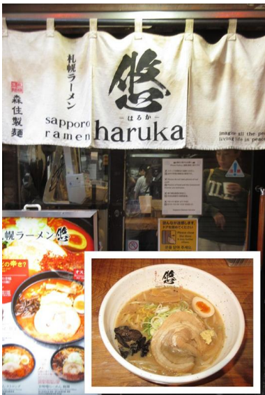
「札幌ラーメン・悠(はるか)」。15分ほど並んで入りました。「みそラーメン」はまさに絶品。すごくおいしかったです。