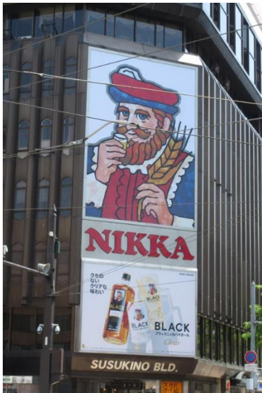
すすきのビルの有名な「ニッカウイスキー看板」。これも札幌の顔。本当は夜の電飾した看板が見たかったです。