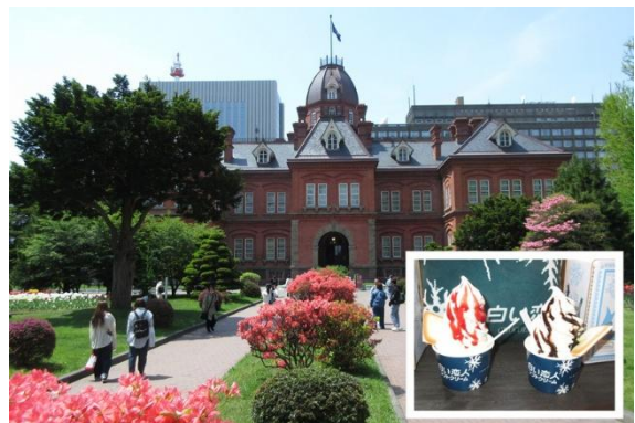
「赤れんが庁舎」。令和の改修を終えてきれいになっています。館内で「白い恋人ソフトクリーム」をいただきました。

赤れんが庁舎の1階には喫茶やお土産コーナーがあり、その一角に「白い恋人」というスイーツラボがあって、ここで「白い恋人ソフトクリーム」を食べました。あまり濃厚ではないあっさりしたソフトクリームに「白い恋人」がトッピングされていました。札幌といえは「白い恋人」なんです。