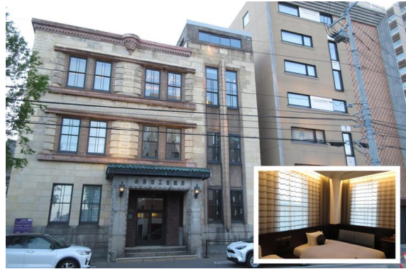
今回のホテル「OMO5 小樽 by 星野リゾート」。向かって左側が「旧小樽商工会議所」を改造した南館で、ここに泊まりました。